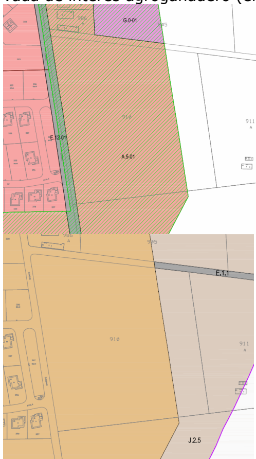
Plano P-3. Calificación global del suelo urbano y urbanizable.

cuestión queda parcialmente clasificada como suelo urbanizable (en su mayor parte) y como suelo no urbanizable (en su parte este), calificada como A.5 - Zona residencial de bajo desarrollo (como parte integrante del ámbito de ordenación pormenorizada DU.09) y como J.2.5 - Zona preservada de interés agroganadero (en su parte no urbanizable).